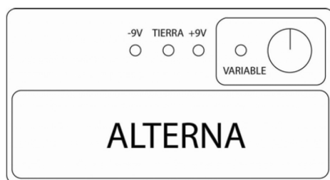
Figura 1: Esquema representativo de una fuente de voltaje.

¿Cómo lograr valores negativos de voltaje? ¿Qué ocurre si se conectan los cables a las distintas salidas de la fuente: -9V, TIERRA, +9V, VARIABLE (ver figura 1)? ¿Qué sucede si se invierten los cables de la fuente una vez que ya están midiendo o ya midieron?