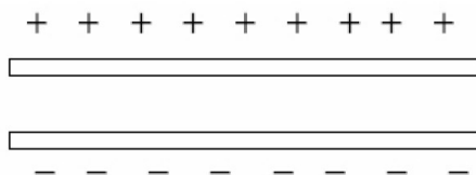
Figura 1: Esquema de un capacitor de placas paralelas.

donde C es la constante de proporcionalidad llamada capacitancia. Esta constante depende de las características del capacitor (superficie de placas y distancia de separación, material entre placas). Las unidades de la Capacitancia son los faradios, F = C/V (Faradio=Coulomb/Volt). Como los F son unidades muy grandes, habitualmente se las utiliza con submúltiplos ( \mu F , pF , etc.).