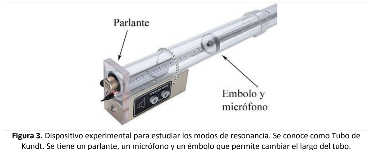
Figura 3. Dispositivo experimental para estudiar los modos de resonancia. Se conoce como Tubo de Kundt. Se tiene un parlante, un micrófono y un émbolo que permite cambiar el largo del tubo.

Se dispone de un emisor acústico (parlante) conectado a un generador de funciones que puede emitir sonidos en un amplio rango de frecuencias y amplitudes (Figura 3). También se dispone de un detector de sonido (micrófono) conectado a un osciloscopio. El parlante se encuentra ubicado en un extremo del tubo y el micrófono puede moverse por el interior del tubo o adjuntarse a un émbolo o pistón que cierra el tubo y provoca que las ondas acústicas se reflejen. Se puede variar la posición del pistón a fin de obtener tubos de Kundt de distinta longitud.