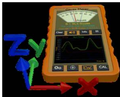
Figura 3: Coordenadas en el Gauss Meter.

Si se puede instalar la aplicación “Gauss Meter” medir la componente Norte ( B_N ) del campo magnético terrestre (ver figura 3).